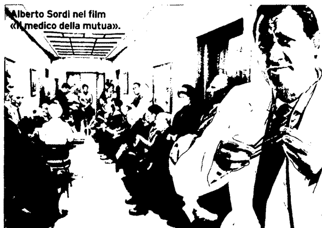
Alberto Sordi nel film «Il medico della mutua».

Mi prescrive riposo per una settimana; aspirina se torna la febbre; un complesso vitaminico. Così ora sono un assenteista: teorico, allegro e con tanto di certificato. In redazione, se volessi, dovrebbero fare a meno di me. Purtroppo, però, è solamente una «prova su strada» a esclusivo fine giornalistico. Ma è anche, e soprattutto, la conferma empirica di un sistema di controlli che non funziona.