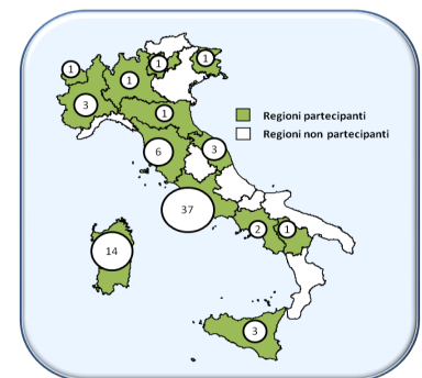
Figura 1 - Regioni partecipanti alla sorveglianza sindromica tramite accessi ai Pronto Soccorso.

Uno o più pronto soccorso sono stati identificati da 13 Regioni. Al mese di dicembre 2010, il sistema di sorveglianza riceve dati da 73 pronto soccorso distribuiti sul territorio nazionale come mostrato in Figura 1.