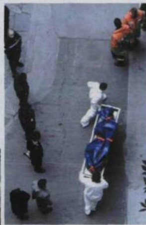
Sopra: una vittima dell'incendio all'Iperbarica del Galeazzi