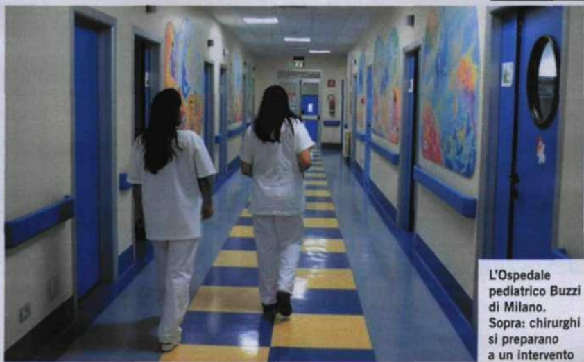
L'Ospedale pediatrico Buzzi di Milano. Sopra: chirurghi si preparano a un intervento