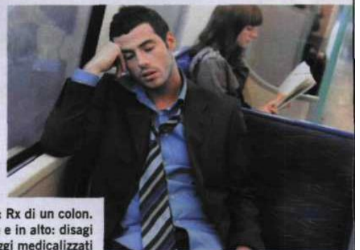
A sinistra: Rx di un colon. A destra e in alto: disagi e apatie oggi medicalizzati

Gambe inquiete Il disturbo comporta l'urgenza di muovere le gambe, e può danneggiare il sonno. Le terapie consigliate comprendono ansiolitici e calmanti. Poche settimane